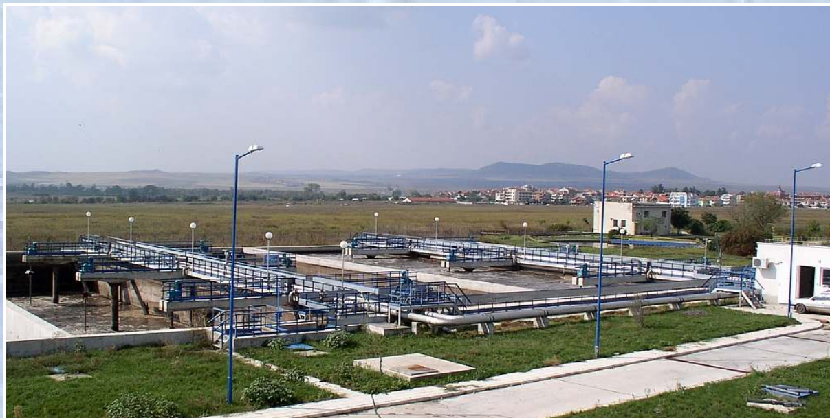
Ansicht der vierstraßigen SBR-Kläranlage des Ressorts SUNNY BEACH