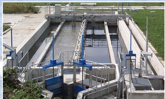
Kläranlagenzulauf mit Schieber und Längssandfang