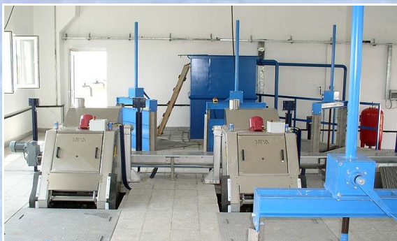
Zweistraßeige Stufenrechenanlage im Gebäude