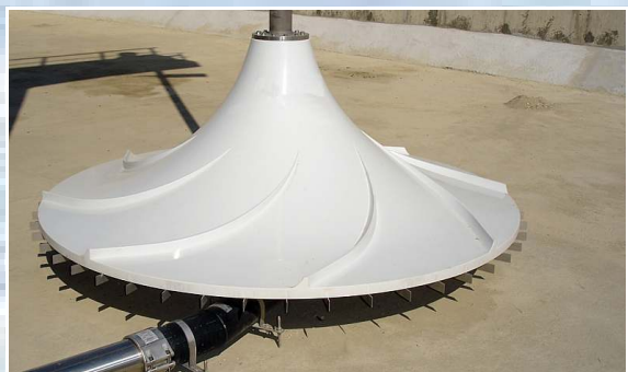
Detailansicht eines Rühr- und Begasungssystems