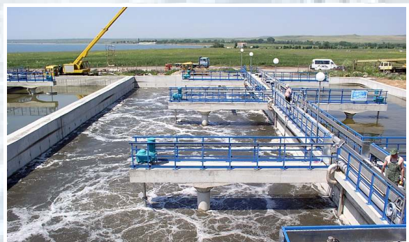
SB-Reaktor während der Belüftungsphase