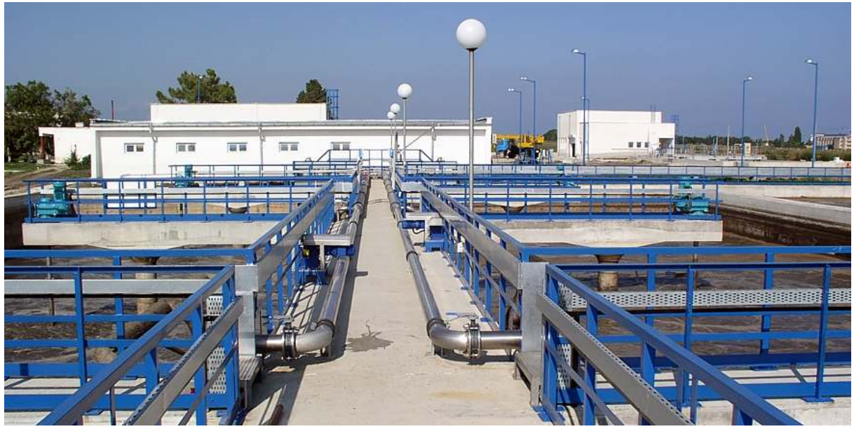
Blick vom Bediensteg auf 2 SB-Reaktoren