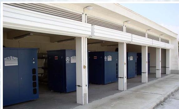
Gebälsestation mit 5 Drehkolbenverdichtern