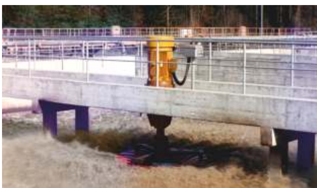
Instalación de una BSK® en la PTAR de Lucerna (Suiza)

Los aireadores superficiales BSK® están disponibles en diferentes diámetros para distintas capacidades de suministro de oxígeno (ver tabla).