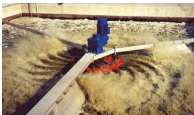
Turbina flotante BSK® (PTAR Krzyz – Polonia)

Es bien sabido que el sistema de aireación en una planta de tratamiento de agua residual representa el mayor consumo de energía en el sitio. Por lo tanto, es importante reducir este consumo al menor nivel posible. Como resultado, la eficiencia del sistema de aireación es un tema importante en la operación a largo plazo. Las turbinas BSK® juegan un papel importante para cumplir con este objetivo.