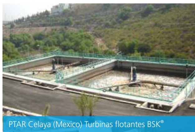
PTAR Celaya (Mexico) Turbinas flotantes BSK®

Dependiendo de la aplicación individual, las turbinas BSK® pueden operar en sistemas de flotación o en unidades de tipo fijo. Ofrecemos unidades de diferentes configuraciones para la operación mediante flotadores para ajustarse a las características específicas del sitio. Las turbinas montadas en flotadores generalmente se usan para Reactores Secuenciales por Lote (SBR).