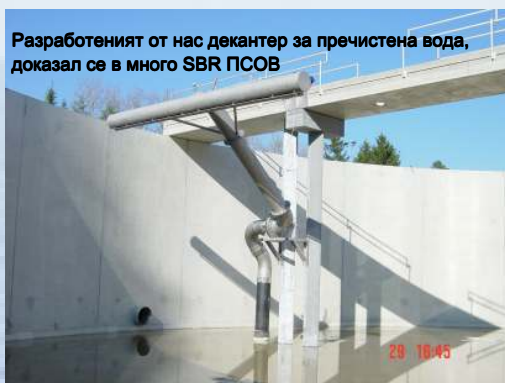
Разработеният от нас декантер за пречистена вода, доказал се в много SBR PCOB