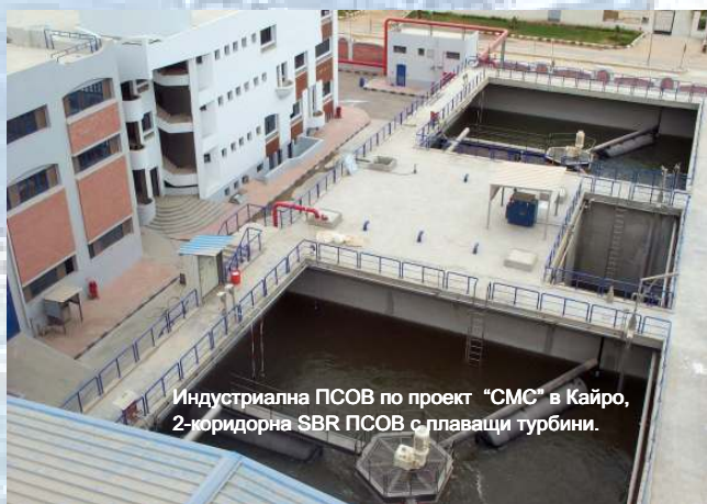
Индустриална PCOB по проект "СМС" в Кайро, 2-коридорна SBR PCOB с плаващи турбини.