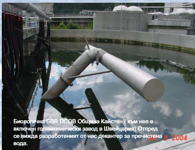
Биологична SBR PCOV Община Кайстен (към нея е включен голям химически завод в Швейцария). Отпред се вижда разработеният от нас декантер за пречиствена вода. 9 2004