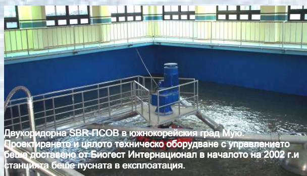
Двухоридорна SBR-ПСОВ в южнокорейския град Мую. Проектирането и цялото техническо оборудване с управлението беше доставено от Биогест Интернационал в началото на 2002 г. и станцията беше пусната в експлоатация.