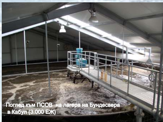
Поглед към ПСОВ на лагера на Бундесвера в Кабул (3.000 ЕЖ)