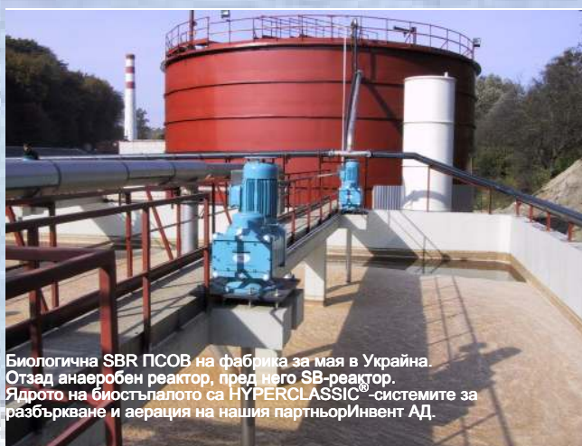
Биологична SBR PCOV на фабрика за мая в Украйна. Отзад анаеробен реактор, пред него SB-реактор. Ядрото на биостъпалото са HYPERCLASSIC®-системите за разбъркване и аерация на нашия партньор Инвент АД.