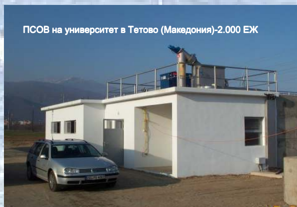
ПСОВ на университет в Тетово (Македония)-2.000 ЕЖ