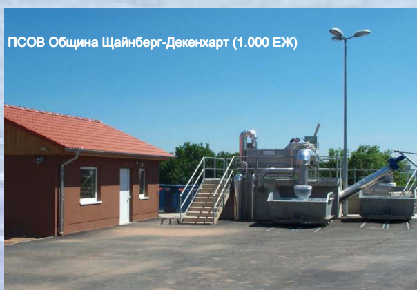
ПСОВ Община Щайнберг-Декенхарт (1.000 ЕЖ)