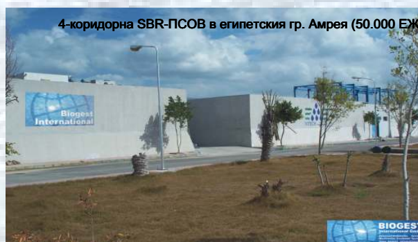
4-коридорна SBR-ПСОВ в египетския гр. Амрея (50.000 ЕЖ)