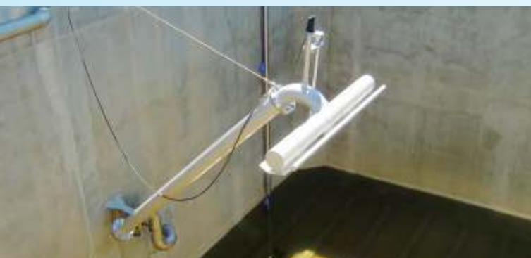
BSK®-Dekanter der Kläranlage Stepanovićevo (Serbien)