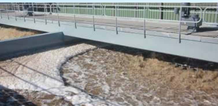
Станция очистки сточных вод одной бумажной фабрики в Испании

Поверхностные аэраторы BSK® изготавливаются в различных диаметрах, что соответствует различной производительности подачи кислорода (стандартные значения: см. Таблицу).