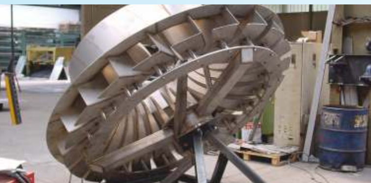
BSK®-турбина, диаметр 2 500 мм (изготовление)

Наши инженеры производят индивидуальные расчеты для каждого проекта. На основании переданных нам параметров мы также оптимизируем конструкцию аэрационных баков, шламовых реакторов, компенсационных резервуаров и т.д.