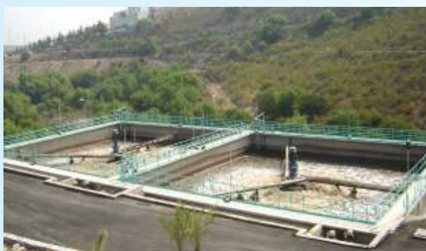
Очистная установка SBR в г. Селяя, Мексика

В зависимости от типа применения аэраторы BSK® могут устанавливаться как стационарно, так и использоваться в качестве плавающих аэраторов. Для стационарной установки подходят стальные или бетонные мосты. Для использования в качестве плавающих аэраторов мы предлагаем специальные системы с различным оснащением и выполненные из различных материалов (специальная сталь или сталь с покрытием). Плавающие аэраторы предпочтительны для использования с технологией SBR (Sequencing Batch Reactor, реактор циклического действия).